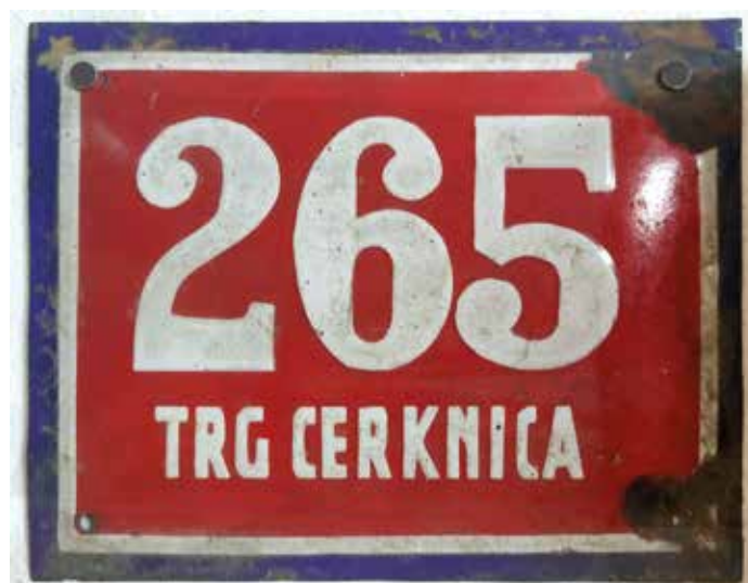
Trg Cerknica 265. Hiše, ki je imela pozneje naslov Tabor 2 in je stala za cerkniškim kulturnim domom, ni več.