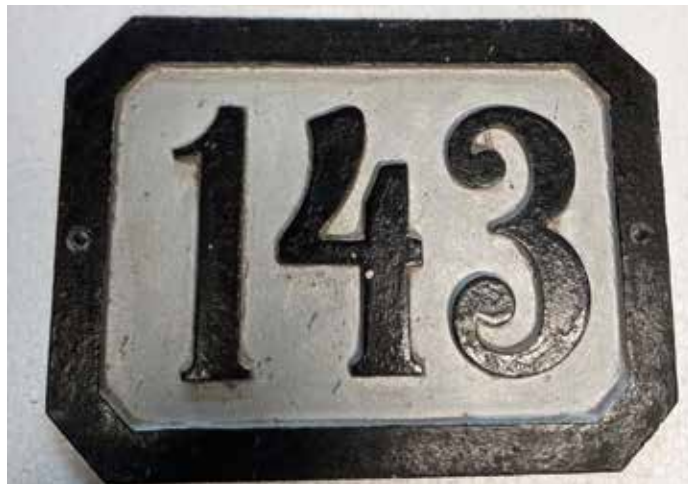
Cerknica 143, današnja Gerbičeva 13, Cerknica