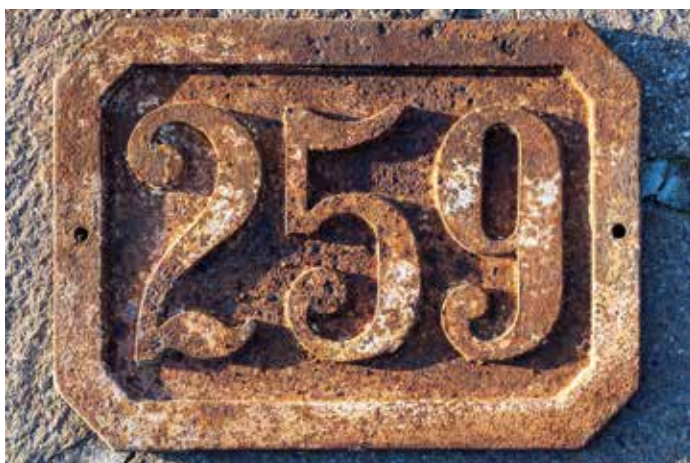
Cerknica 259, današnja Gerbičeva 10, Cerknica