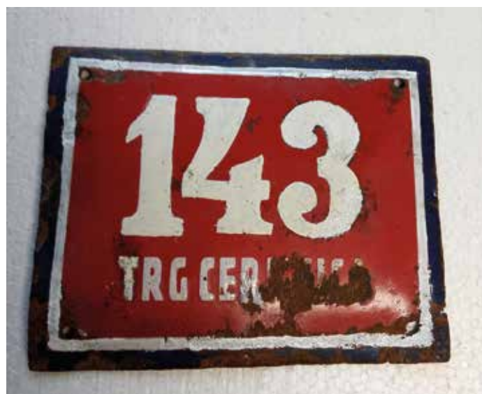
Trg Cerknica 143, današnja Gerbičeva 13, Cerknica, zbirka: Branko Ličen