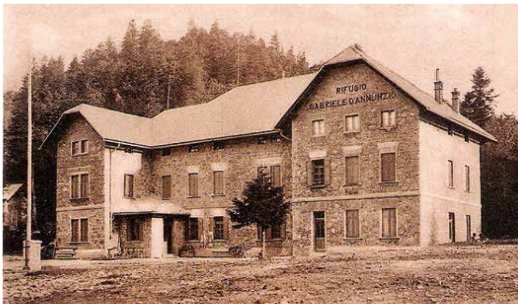
Rifugio Gabriele d'Annunzio (planinsko zavetišče Gabriele d'Annunzio), zgrajeno 1926 v neposredni bližini današnjega planinskega doma na Sviščakih.

Ob določevanju meje v gozdovih Snežnika je imela razmejitvena komisija Kraljevine SHS svoj operativni sedež tudi na gradu Snežnik. Kako je na delo komisije in potek