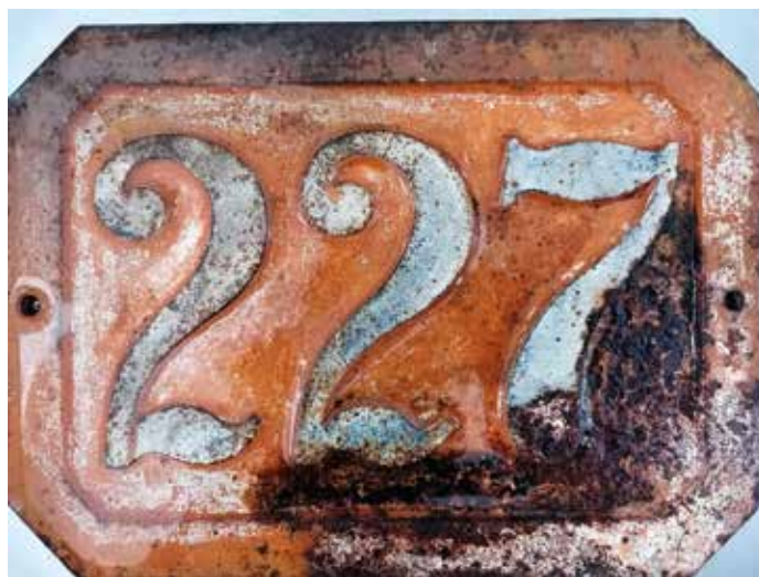
Cerknica 227, današnja Zidanškova 1, Cerknica