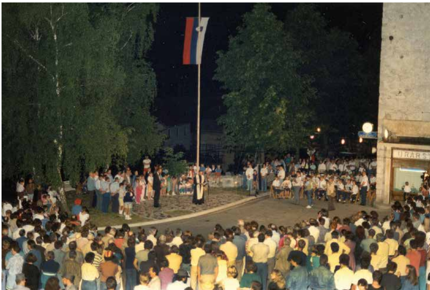
Proslava na Taboru ob osamosvojitvi 26. 6. 1991