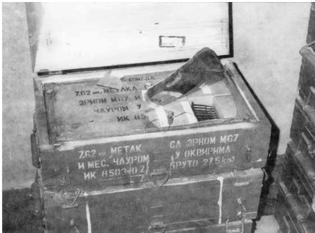
Orožje iz vojašnice Rakek 20. 10. 1991