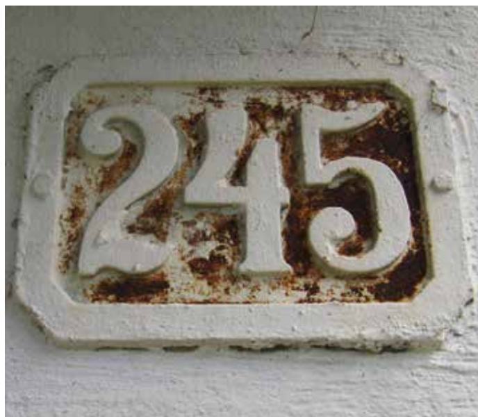
Cerknica 245, današnja Kamna gorica 29, Cerknica