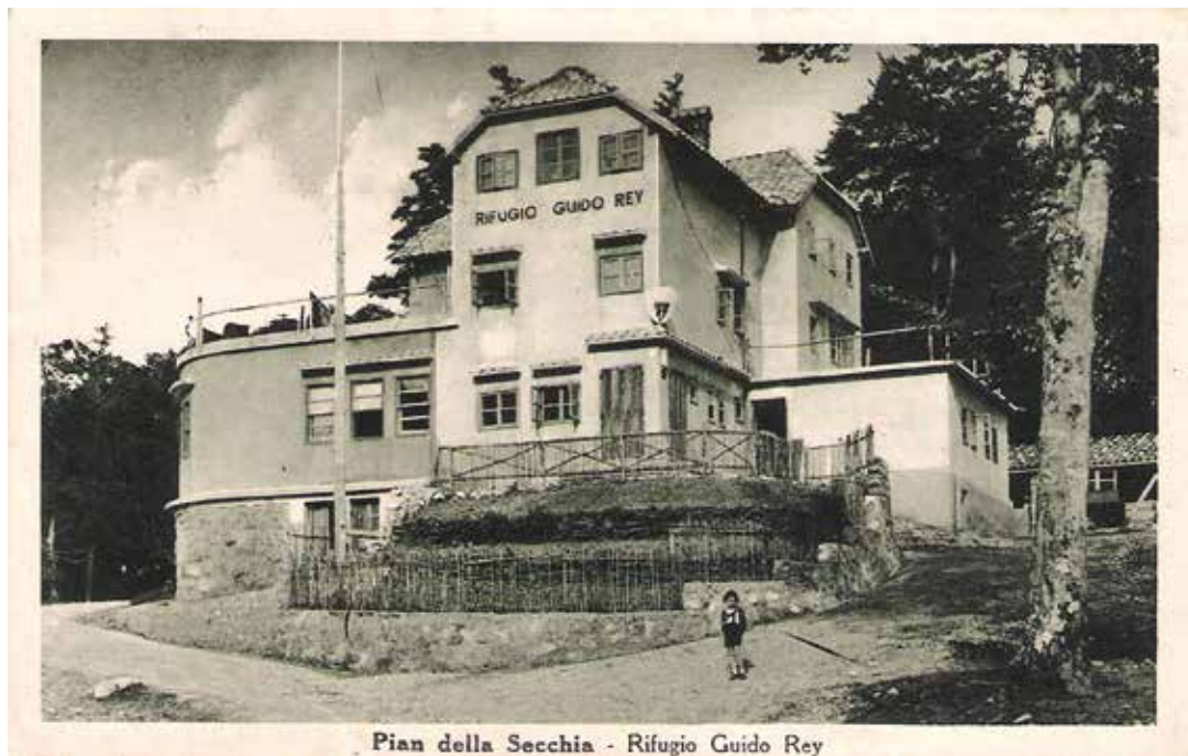
Pian della Secchia - Rifugio Guido Rey

Refugio Guido Rey – Piani della Secchia – nadmorska višina 1272 m – je bil planinski hotel ter ponos reške planinske sekcije.