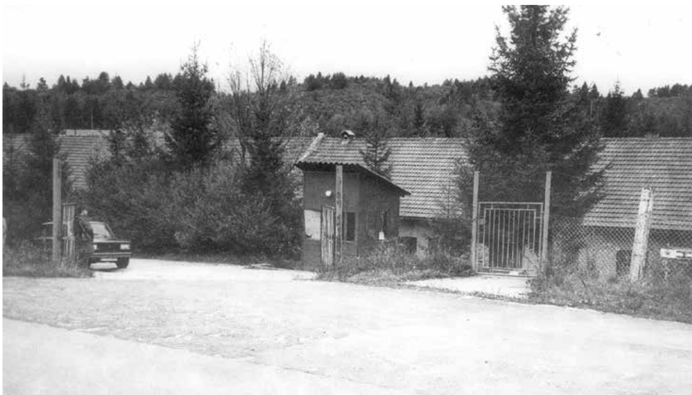
Vojašnica Rakek 20. 10. 1991