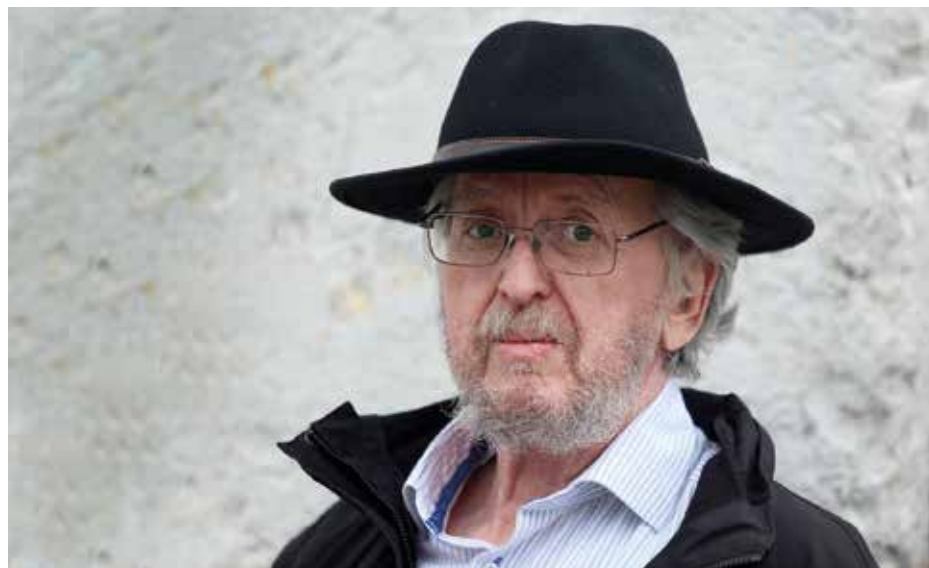
Rad ima notranjsko naravo, zadnje čase pa vseeno pogreša družabno, urbano življenje.

Ja. Glasbena šola je takrat bila najprej na Rakeku, potem so jo odprli še